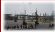
Prins Mauritschool Gemeenteweg 326a, Staphorst 0522-461325 www.pmstaphorst.nl